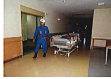
▲実際の避難訓練の様子

九月十四日に夜間総合防災訓練を行いました。近隣住民の方々や、行政、消防の方々のご協力により、毎年実施している活動ですが、今年も滞りなく終了する事が出来ました。夜間総合防災訓練後の反省会にも多数のご出席頂きありがとうございます。今後も毎月の防災・防犯訓練を重ねながら、防災・防犯意識の向上に努めて参ります。