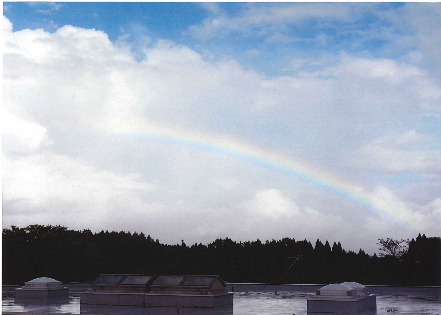
表紙：台風一過で空に架かる虹