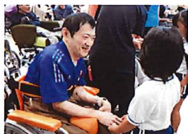
▲可愛い園児を前に笑顔がこぼれます

敬老行事の後には、全体会食があり、ちらし寿司などのメニューが振舞われました。また、デザートとしてお祝い者にはお祝いケーキが、その他の利用者にもショートケーキが用意され、皆さん美味しく食べていました。